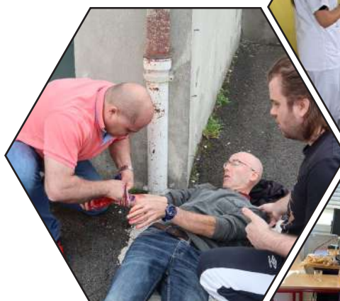
AFGSU niveau 2