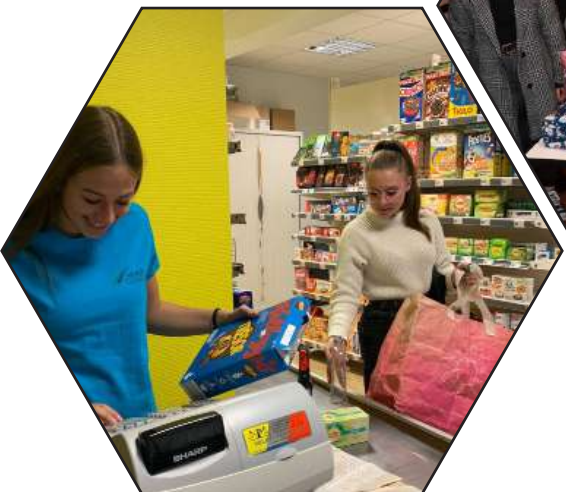
Vente en magasin pédagogique