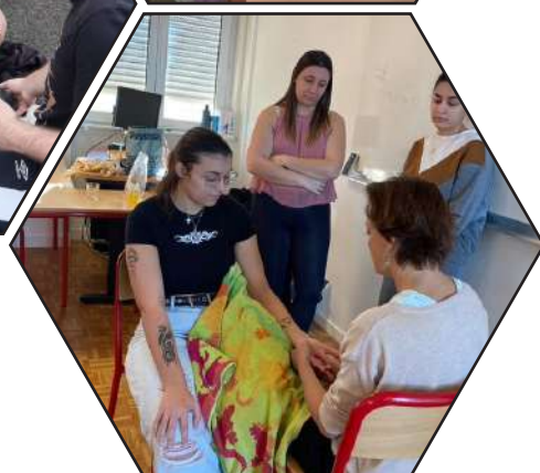
Cours de massage/bien être