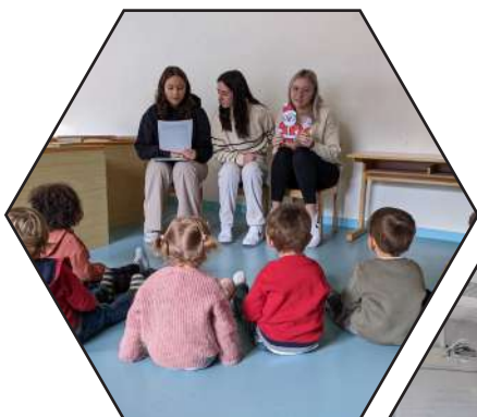
Animation avec les enfants