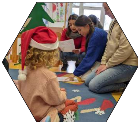
Animation auprès des enfants