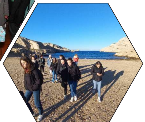
Voyage scolaire à Marseille