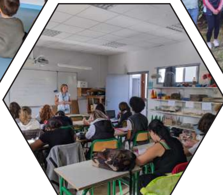
Des cours encadrés par des professionnels