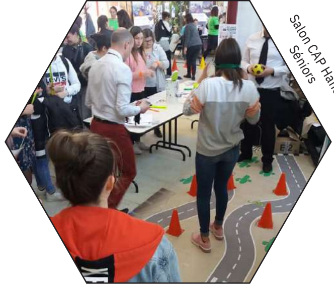
Salon CAP Handi Séniors