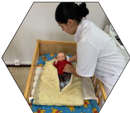
Soin à l'enfant