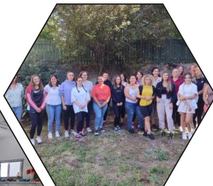
Des journées découvertes